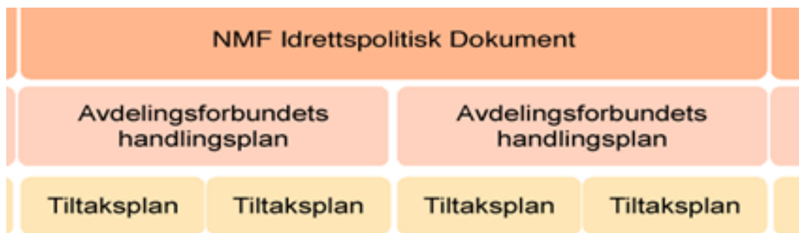
Figuren illustrerer strukturen basert på 4-, 2- og 1-årige planer

NMF Idrettspolitisk Dokument (Ipd) skal danne grunnlaget for det øvrige planarbeidet i forbundet. Hver av avdelingsforbundene skal vedta toårige handlingsplaner på sine årsmøter mellom tingperiodene. Avdelingsforbundets grener er så pålagt å fremme årlige tiltaksplaner med budsjett på bakgrunn av avdelingsforbundets handlingsplan for perioden. Tiltaksplan med budsjett godkjennes i avdelingsforbundets styre.