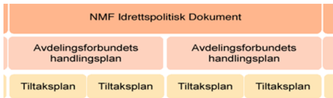
Figuren illustrerer strukturen basert på 4-, 2- og 1-årige planer

NMF Idrettspolitisk Dokument (Ipd) skal danne grunnlaget for det øvrige planarbeidet i forbundet. Hver av avdelingsforbundene skal vedta toårige handlingsplaner på sine årsmøter mellom tingperiodene. Avdelingsforbundets grener er så pålagt å fremme årlige tiltaksplaner med budsjett på bakgrunn av avdelingsforbundets handlingsplan for perioden. Tiltaksplan med budsjett godkjennes i avdelingsforbundets styre.