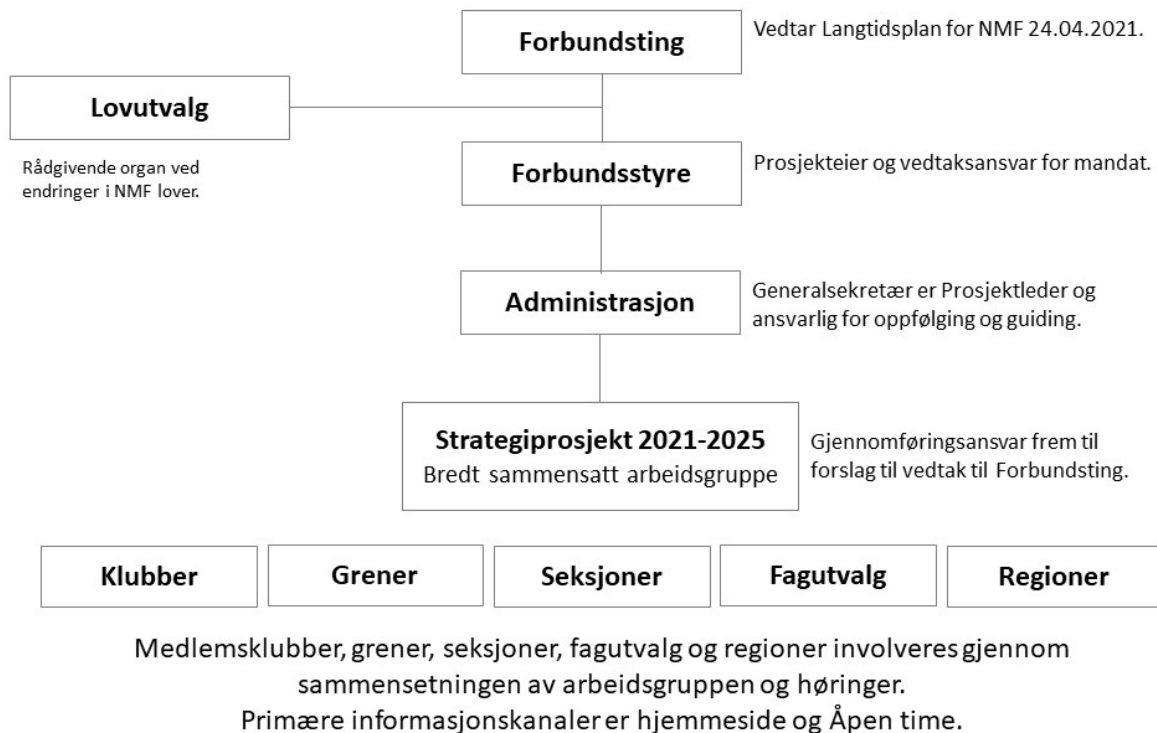
Figur 1, organisasjonskart prosjekt NMF strategi 2021-2025